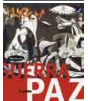
CAPA • Guernica, Pablo Picasso • reprodução