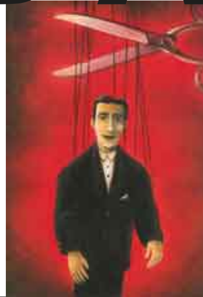
ILUSTRAÇÃO DA URNA, MÁRCIO CURIA, COLABORAÇÃO DE DENISONBRASIL

ÓLEO SOBRE TELA • NIZAN GUANES E SÉRGIO GORDILHO