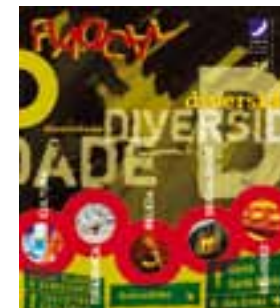
Capa • Diversidade